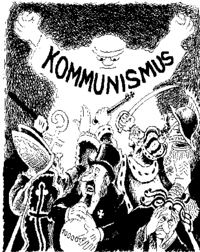
Ein Gespenst geht um in Europa...

Und nun viel Spaß beim Lesen, Diskutieren und Weltverändern!