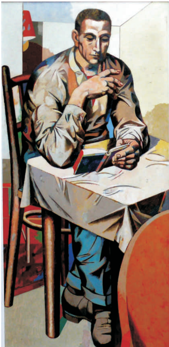
Willi Sitte: Arbeitertriptychon I (Sitte war einer der bedeutendsten Künstler der DDR)

Sahra Wagenknecht: Marxismus und Opportunismus - Kämpfe in der Sozialistischen Bewegung gestern und heute. Weißenseer Blätter, 4/1992, S. 12-26.