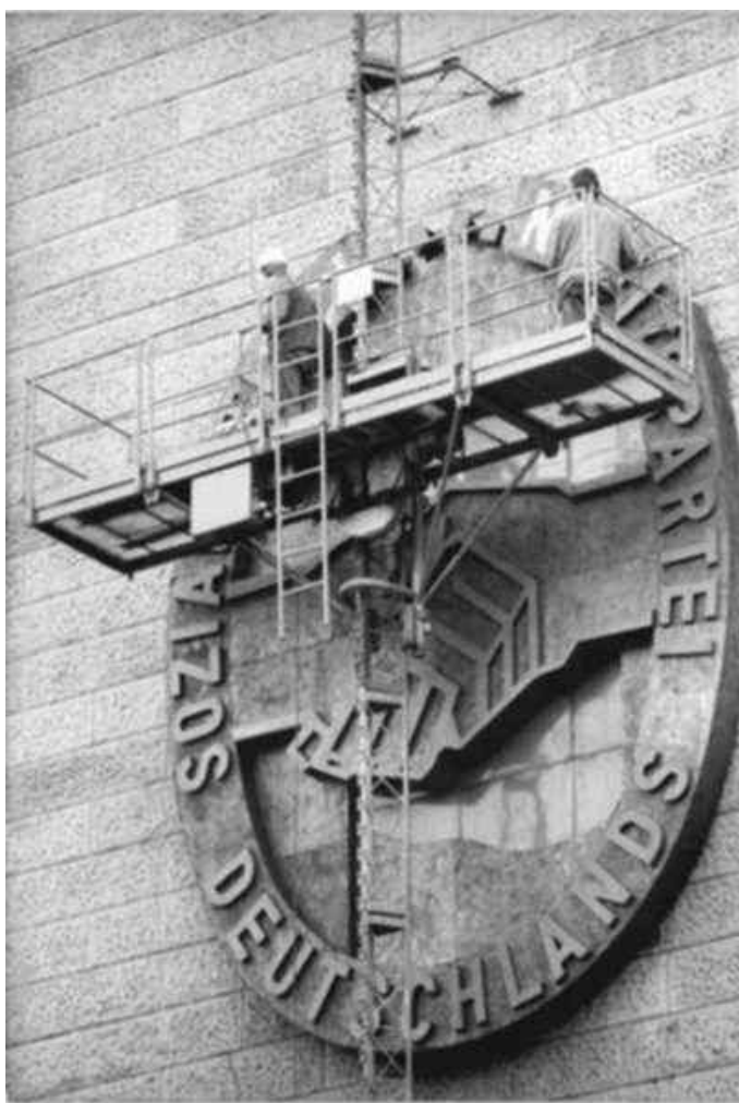
An der Vorderfront des ehemaligen ZK-Gebäudes wird im Januar 1990 das SED-Symbol abmontiert

revolution auf Filzlatschen“ bezeichnete, wurde unterschätzt. Sie bestätigte und setzte sich fort in der Unterzeichnung der Abschlusßakte der „Konferenz für Sicherheit und Zusammenarbeit in Europa“ (KSZE) 1975 und fand ihren unrühmlichen Tiefpunkt in der Billigung des gemeinsamen Dokuments von SED und SPD vom August 1987, in dem dem Imperialismus plötzlich eine „Reform- und Friedensfähigkeit“ bescheinigt wurde. An die Stelle der friedlichen Koexistenz als Form des Klassenkampfes trat ein friedlicher Systemwettbewerb auf der Grundlage gemeinsamer Menschheitsinteressen. Auf dem Feld der Kultur- und Geschichtspolitik wurden mehr und mehr die Gemeinsamkeiten mit der BRD hervorgehoben. Ungelöste ökonomische Probleme, Stagnation, gar Zeichen des beginnenden Verfalls in Versorgung und Infrastruktur und das Schweigen der Partei darüber ließen den Rückhalt in der Bevölkerung aber auch in der eigenen Mitgliedschaft drastisch schwinden. Vor der wachsenden Unzufriedenheit kapitulierte eine Partei letztlich kampfflos, die im Inneren gelähmt war und deren Führung längst keinen klaren Kurs mehr besaß. Eine Abwendung der tragischen Ereignisse des Jahres 1989 hätte die Führung einer zielklaren revolutionären Partei und die feste Verbindung mit den Massen zur Voraussetzung gehabt. Diese Voraussetzungen waren in der DDR 1989 nicht mehr gegeben.