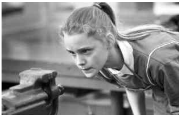
Polytechnischer Unterricht in der Karl-Marx-Stadt, 1989

Das Bildungssystem in der DDR war einerseits darauf ausgerichtet, Fachkräfte nach den Bedürfnissen des gesellschaftlichen Plans auszubilden, der auf einen weiteren Ausbau der sozialen Errungenschaften ausgelegt war; andererseits sollten sozialistische Persönlichkeiten entwickelt, tradierte Herrschaftsverhältnisse – etwa das zwischen Lehrmeister und