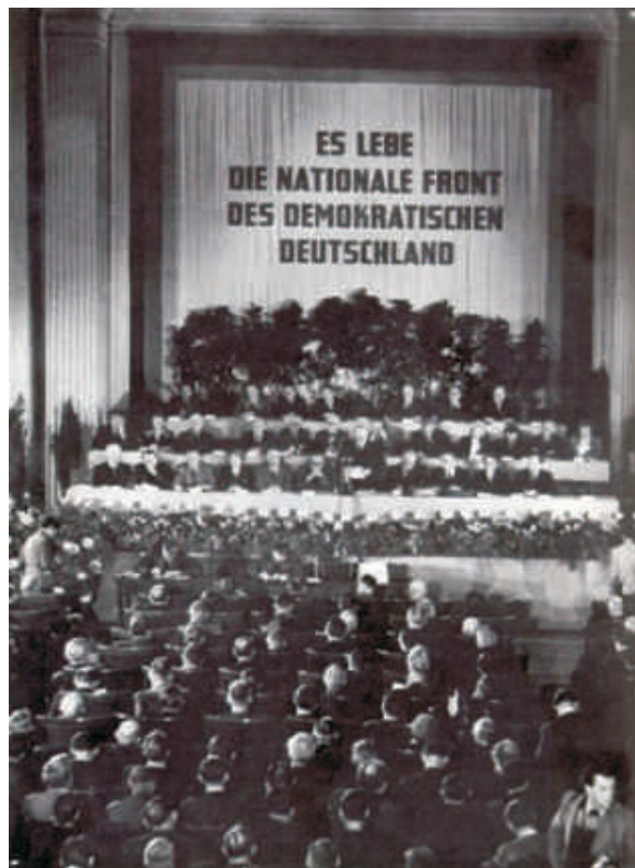
Konstituierende Sitzung der Provisorischen Volkskammer der DDR am 7. Oktober 1949

Obgleich sowohl der Kontrollrat als auch die maßgeblichen Kräfte in allen vier Militärregierungen zunächst bestrebt waren, die Potsdamer Beschlüsse in ihren Besatzungsgebieten umzusetzen, kam es doch bald in den drei westlichen Besatzungszonen zu Bemühungen, die zunächst einheitlich gefassten Beschlüsse zu umgehen und für diese drei Besatzungsgebiete eine separate Politik zu verfolgen, die ein einheitliches Weiterarbeiten des Kontrollrates verhinderte und darauf abzielte, das in Potsdam vereinbarte Ziel der Schaffung eines antifaschistischen und demokratischen neutralen Deutschlands zu ver-