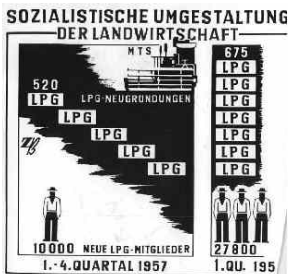
Neubegründung der LPG 1957

Das alte Bildungsprivileg war überwunden. Die Hochschulbildung war kostenfrei, der Weg zu Hochschule wurde den Arbeiter- und Bauernkindern über ein Abitur an den Arbeiter- und Bauernfakultäten der Universitäten ermöglicht. Ein einheitliches Bildungssystem sicherte ein hohes Bildungsniveau im Schulsystem.