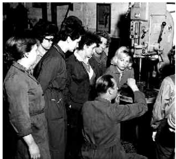
Frauenlehrgang in der DDR

In der DDR war bis zu diesem Zeitpunkt ein einheitliches Sozialversicherungssystem geschaffen worden, das allen Bürger eine kostenlose medizinische und eine unentgeltliche Versorgung mit Medikamenten sicherte. Die Lebensmittelpreise wurden staatlich subventioniert, auf einem stabilen Niveau gehalten. Die Gleichberechtigung der Frauen war gesetzlich festgesetzt und im Arbeitsprozess gesichert. Sie bekamen die gleichen Löhne für die gleiche Arbeit wie ihre männlichen Kollegen. Es waren Kindertagesplätze in Betrieben und Wohngebieten entstanden. Arbeitslosigkeit war in der DDR unbekannt, ebenso Wohnungslosigkeit, auch wenn in der frühen Zeit das Wohnungsproblem noch nicht gelöst war und die Altbausubstanz dominierte. Doch die ersten Wohnungsbaugenossenschaften entstanden, die von volkseigenen Betrieben getragene Neubauwohnungen für eine geringe Miete schufen.