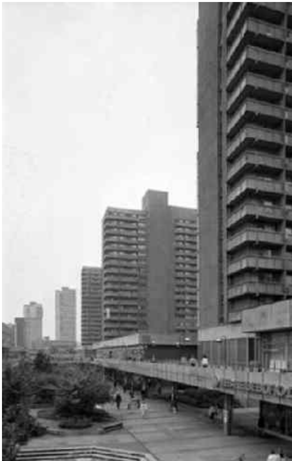
Neubaugebiet im Zuge des Wohnungsbauprogramms in Halle-Neustadt