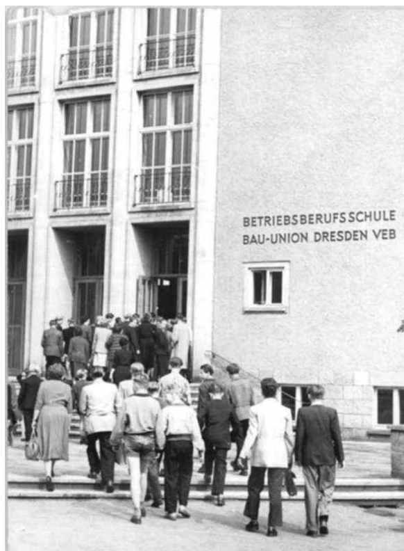
Betriebsberufsschule bei ihrer Gründung 1955 in Dresden

Für Jugendliche, die die Oberschule ohne Abschluss der 10. Klasse verließen, gab es spezielle Wege einer beruflichen Ausbildung. Für alle Jugendlichen, die sich nicht zu einem Hoch- oder Fachhochschulstudium entschieden, war eine Berufsausbildung gesichert. Die Mehrzahl wurde in sog. Grundberufen ausgebildet, die sie im Verlauf der Ausbildung weiter spezialisieren konnten. Der überwiegende Teil der Ausbildungszeit wurde für Grundlagenbildung, der Rest auf die berufliche Spezialisierung verwandt. Der Berufsschulunterricht fand in Betriebs- oder kommunalen Berufsschulen statt und wurde von speziell ausgebildeten Pädagogen betrieben. Die Ausbildungsbetriebe waren verpflichtet, dem Auszubildenden ein halbes Jahr vor dessen Abschluss einen berufsgerechten Arbeitsplatz anzubieten.