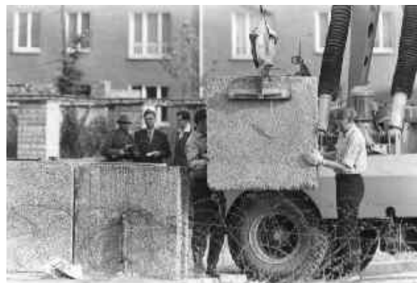
Mauerbau 1961 in Berlin

Der Sozialismus der DDR verstand sich nicht nur als Diktatur des Proletariats, sondern war zunehmend bestrebt, alle Schichten der Bevölkerung in den sozialistischen Aufbau zu integrieren und zugleich die nationale Frage damit zu lösen. Im ganzen sozialistischen Lager gestalteten sich die gesellschaftlichen Verhältnisse derart, dass eine kontinuierliche Bewältigung der Probleme beim Aufbau einer sozialistischen Gesellschaft möglich war. Die weitere Ausgestaltung der sozialistischen Demokratie wurde zunächst erfolgreich fortgesetzt, vor allem im Bereich der örtlichen Organe. Die demokratische Gestaltung sozial geprägter Kommunalpolitik war gewährleistet durch Mitarbeit und Initiative der Werktätigen in den Stadt- und Kreisvertretungen. Auch in den von der Bevölkerung gewählten Schiedskommissionen wurden viele lokale Probleme gelöst und die Gerichte von ihnen entlastet. Aber dieses erreichte Niveau kollidierte mit der Zeit immer stärker mit der demokratischen Ge-