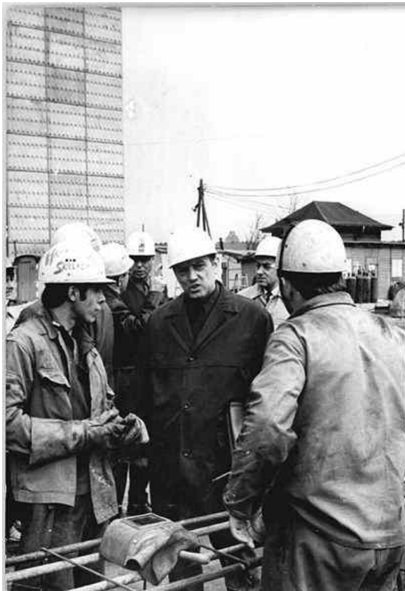
Arbeiter und Bauerninspektion 1971 in Leipzig

Walter Ulbricht versuchte, seine internationale Autorität nutzend, die DDR nunmehr über die Anwendung der